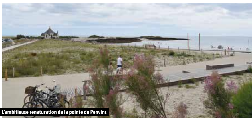
L'ambitieuse renaturation de la pointe de Penvins

Malgré un contexte difficile, l'année 2022 a permis d'accélérer le déploiement du programme d'investissements après les deux années de crise sanitaire. Les dépenses d'équipement ont augmenté de façon significative entre 2020 et 2022 (4 M€ au CA 2020, 8,3 M€ pour 2021 et 13,5 M€ pour 2022), avec la poursuite et le lancement d'importants projets comme celui de la construction de la nouvelle salle multisports, la réfection de la piste d'athlétisme et du terrain de foot, l'aménagement du Bindo, du chemin de Kerhuelon, des rues de Kerthomas et de la Compagnie du Capitaine Jacky Thomas, la renaturation de la pointe de Penvins, le dévase-ment du port de Saint-Jacques, l'extension du réseau cyclable, l'implantation du cinéma, la reprise en régie de la restauration scolaire, le démarrage du projet de santé territorial, etc.