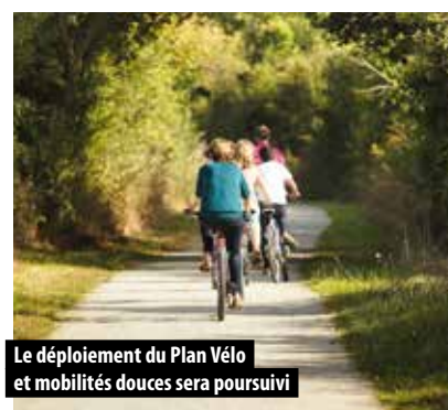
Le déploiement du Plan Vélo et mobilités douces sera poursuivi