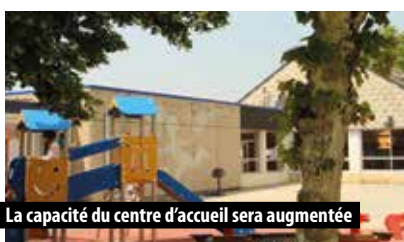
La capacité du centre d'accueil sera augmentée