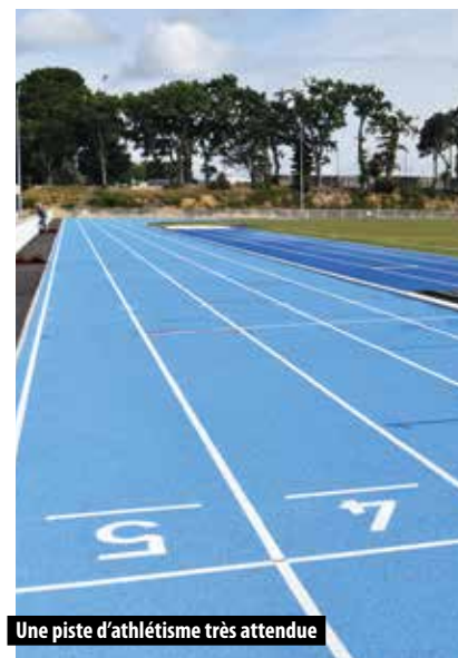
Une piste d'athlétisme très attendue

En mars 2022, après des aménagements techniques de la salle de spectacle de l'Hermine, Sarzeau a inauguré le nouveau cinéma communal. Au 1 er janvier 2023, la saison culturelle est de nouveau pilotée par la commune. Cette rétrocession de GMVA résulte du souhait de la commune de gérer en direct la programmation du Centre Culturel, dont le cinéma, afin de développer des synergies avec la politique culturelle de la ville.