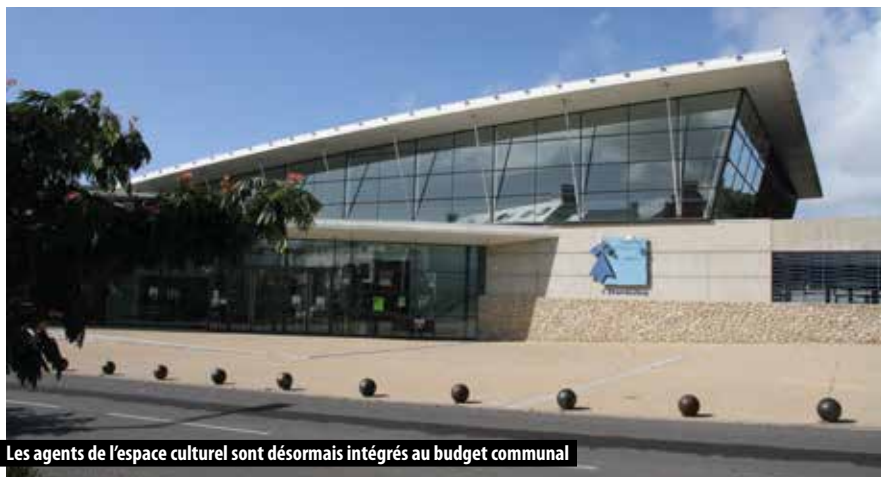
Les agents de l'espace culturel sont désormais intégrés au budget communal

Les dépenses réelles de fonctionnement sont, quant à elles, prévues à hauteur de 11 535 k€ (hors frais financiers), soit une augmentation d'environ 13 % par rapport au compte administratif 2022, expliquée tant par le contexte économique, que par les besoins des nouveaux équipements et l'intégration de la « saison culturelle » au budget communal. En effet, l'inflation et la hausse des coûts qui en découle devraient fortement impacter les différentes charges à caractère général. Les dépenses de personnel sont quant à elles prévues à hauteur de 6 330 k€. L'augmentation d'environ 8 % en comparaison avec le compte administratif 2022 s'explique ici par plusieurs facteurs : la revalorisation du SMIC et du point d'indice sur une année complète, la mise en place de titres-restaurants et l'intégration des agents de l'Espace Culturel de l'Hermine au budget communal. La subvention 2023 de la commune au CCAS reste la même qu'en 2022 : 268 k€.