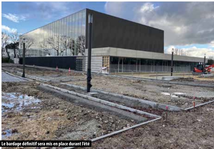
Le bardage définitif sera mis en place durant l'été

Les conséquences de la pandémie de Covid-19, qui a chamboulé notre quotidien voici bientôt trois ans, sont innombrables. Parmi celles-ci, on compte la pénurie de bois d'œuvre, nécessaire à la construction. Le chantier de la salle multisports en a été directement impacté pour la fourniture du bardage bois pour la réalisation de la façade.