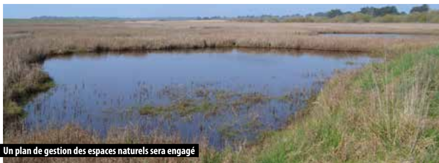
Un plan de gestion des espaces naturels sera engagé