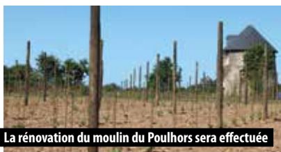
La rénovation du moulin du Poulhors sera effectuée