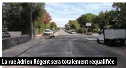
La rue Adrien Régent sera totalement requalifiée