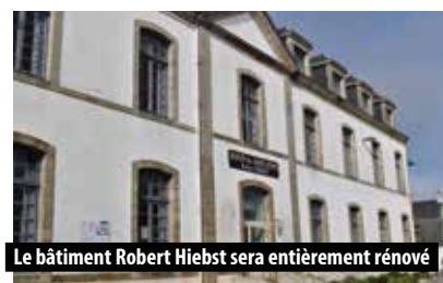
Le bâtiment Robert Hiebst sera entièrement rénové