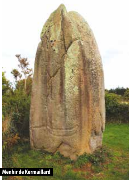
Menhir de Kermaillard

Quatre monuments sarzeautins se situent dans l'aire 3 au cœur du bien UNESCO : le menhir de Kermaillard, le dolmen de Er Le, le fuseau de Jeannette (menhir), le dolmen du Riellec mais aussi le dolmen de Bréhuidic qui a aujourd'hui disparu.