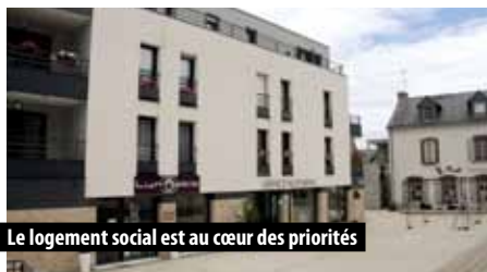
Le logement social est au cœur des priorités

Le logement accessible est une priorité depuis 12 ans et les résultats sont là. Sarzeau récupère son retard et nous allons continuer à produire des logements accessibles mais en respectant l'intégration au tissu urbain existant. Il y a aujourd'hui 130 demandes environ non satisfaites sur le territoire communal et la loi nous oblige à produire 600 logements, c'est absurde ! Cette loi avait été renforcée sous François Hollande comme pour mieux stigmatiser certaines communes. Il faut être réaliste, aucun bailleur social ne construira les logements dont nous n'avons pas besoin ! C'est aussi une conséquence directe de la fusion au sein de Golfe du Morbihan - Vannes Agglomération et cette obligation n'existait pas avant 2017 car nous étions en Communauté de Communes. Nous allons également continuer à proposer des lots dans des opérations communales pour les jeunes ménages afin de favoriser l'accession à la propriété.