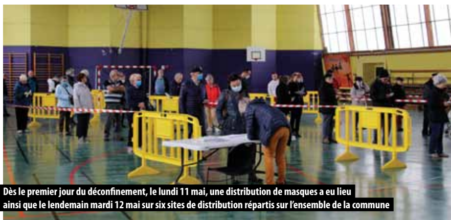
Dès le premier jour du déconfinement, le lundi 11 mai, une distribution de masques a eu lieu ainsi que le lendemain mardi 12 mai sur six sites de distribution répartis sur l'ensemble de la commune