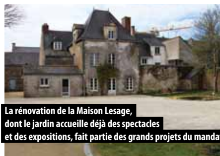
La rénovation de la Maison Lesage, dont le jardin accueille déjà des spectacles et des expositions, fait partie des grands projets du mandat

Nous avons des agents communaux et du CCAS de grande qualité, investis et qui ne ménagent pas leur peine au service de notre commune. Je veille à la qualité des relations avec les agents en étant attentif à leurs remarques mais en donnant aussi des orientations claires. Leur investissement est une chance pour Sarzeau.