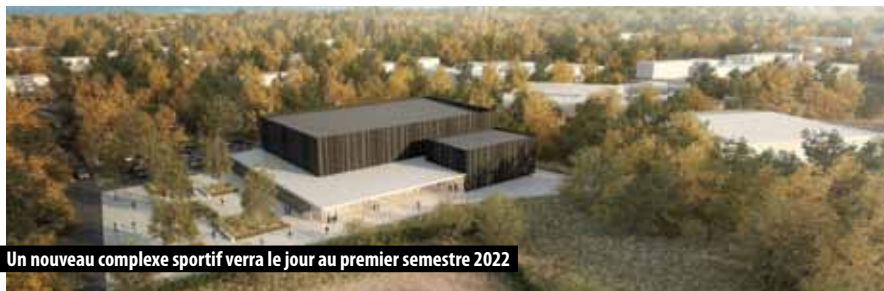
Un nouveau complexe sportif verra le jour au premier semestre 2022