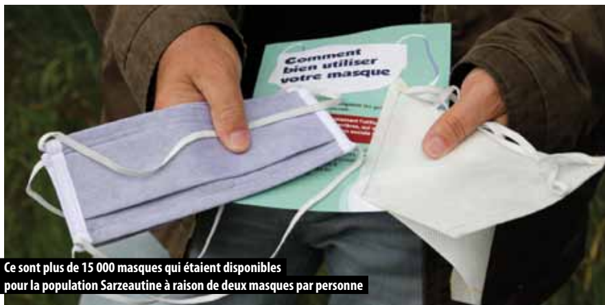
Ce sont plus de 15 000 masques qui étaient disponibles pour la population Sarzeautine à raison de deux masques par personne