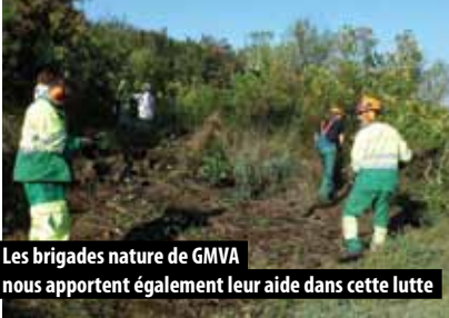
Les brigades nature de GMVA nous apportent également leur aide dans cette lutte

Le développement du Baccharis halimifolia (espèce exotique envahissante) sur notre littoral cause des dégâts considérables sur les milieux naturels et induit une forte perte de biodiversité. Le Baccharis est maintenant visé par la réglementation européenne et française. L'introduction dans le milieu naturel (notamment en raison de la libération de graines dans l'environnement), y compris par négligence ou imprudence, est maintenant prohibée. Il convient donc de l'éliminer.