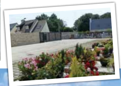
Des travaux similaires sont prévus sur l'ancien cimetière dès le début de l'année 2020.