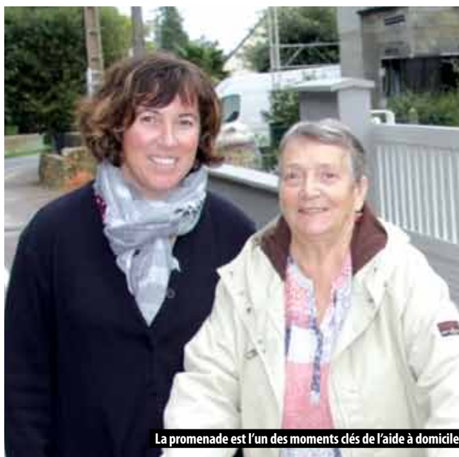
La promenade est l'un des moments clés de l'aide à domicile