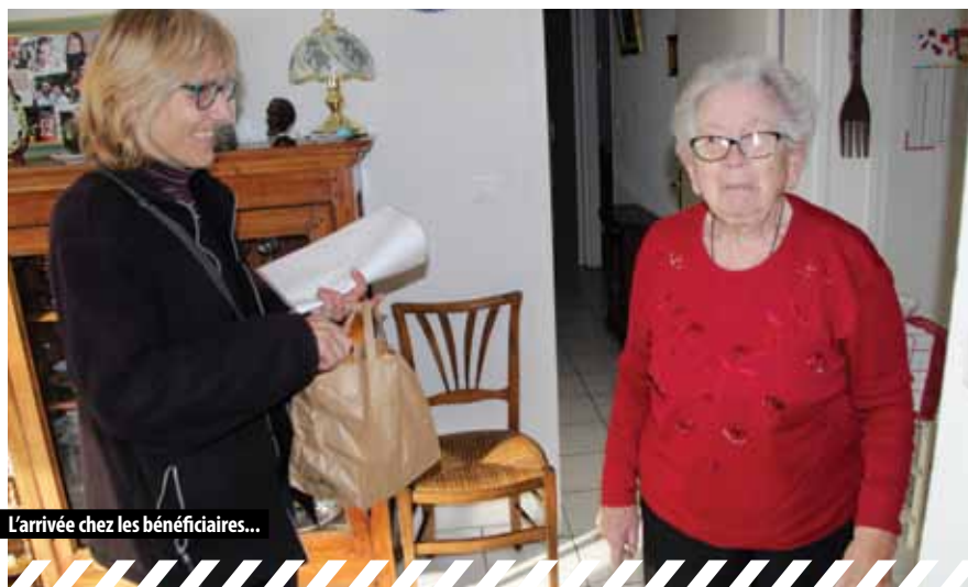
L'arrivée chez les bénéficiaires...

Le CCAS gère un service de portage de repas à domicile : toute personne âgée de 60 ans et plus, ou en situation de handicap temporaire (retours d'hospitalisation, maladies ou accidents) ou définitif, peut bénéficier du service de repas à domicile.