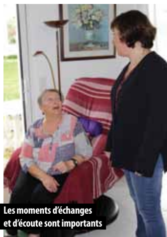
Les moments d'échanges et d'écoute sont importants