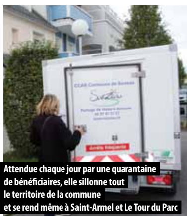
Attendue chaque jour par une quarantaine de bénéficiaires, elle sillonne tout le territoire de la commune et se rend même à Saint-Armel et Le Tour du Parc

Car au-delà de la simple livraison de repas, c'est aussi un lien social qui est créé, une écoute parfois attendue par les personnes.