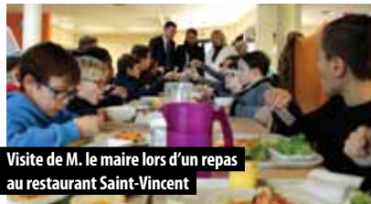
Visite de M. le maire lors d'un repas au restaurant Saint-Vincent

Du 2 au 6 décembre 2019, les trois restaurants scolaires : Saint-Vincent, Saint-Colombier, Adrien Régent ont ouvert leurs portes aux familles qui souhaitent se familiariser avec le fonctionnement des sites et déguster les mets préparés par le prestataire Armonys Restauration. L'occasion pour les parents de découvrir ou redécouvrir les lieux, de visiter la cuisine centrale Adrien Régent où sont préparés chaque jour les repas qui sont servis à 530 enfants en moyenne, à travers ces trois sites. En effet, les denrées sont livrées «brutes» à Régent puis après la partie production des plats, un agent est responsable de la livraison des deux «satellites». Les menus sont préalablement étudiés lors d'une réunion où élus, représentants des parents, directions des écoles, représentants des collégiens et prestataire font l'ajustement de ce qui plairait aux petites bouches. Si vous avez passé votre tour, il est toujours possible de venir s'inscrire à la mairie pour venir savourer les mets.