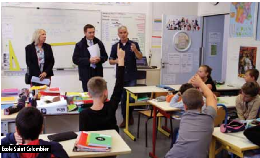
École Saint Colombier