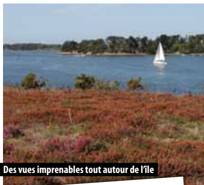
Des vues imprenables tout autour de l'île

Pour les propriétaires, une île est un émerveillement perpétuel mais donne aussi beaucoup de soucis.