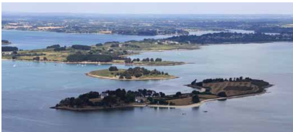
Située entre Govihan et l'île aux Moines, l'île de Brannec

Auparavant propriété de l'Abbaye de Rhuys comme bon nombre d'îles du Golfe du Morbihan, elle fût aliénée en 1552.