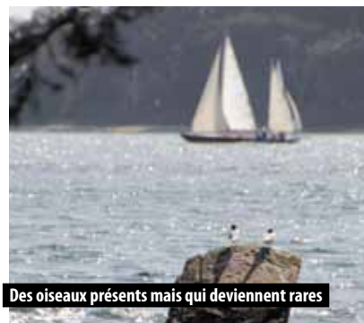
Des oiseaux présents mais qui deviennent rares