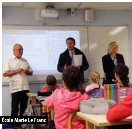
École Marie Le Franc