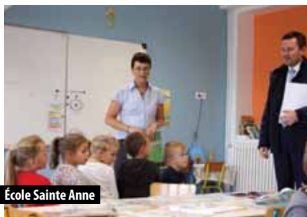
École Sainte Anne