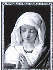
« Vierge priante », huile sur toile de l'atelier de Giovanni Battista Salvi, dit Sassoferato (Sassoferato, 1609-Rome, 1685), poussée à 23 000 €.