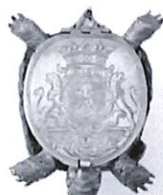
Boîte à pilules « tortue » de la fin XVIII e -début XIX e vendue 11 000 €.

Mais c'est au rayon des objets de curiosité que les commissaires-priseurs morbihanais ont enregistré la plus belle surprise de cette journée d'été avec une ravissante boîte à pilules « tortue » de la fin XVIII e -début XIX e . La rareté et la certitude de la provenance de ce charmant objet ont fait toute sa valeur. Avec sa carapace miniature naturelle, ses pattes et sa tête en argent et un couvercle à charnières gravé d'armoiries à supports de lions surmontés d'une couronne de marquis, elle a été particulièrement disputée. L'ancienne appartenance à la famille Le Berceur De Fontenay (Normandie, Poitou) ayant été titrée « Marquis de Fontenay » en 1673 et ayant eu un Page du Roi en 1703 à certainement joué sur l'engouement généré par cette délicate boîte. Estimée environ 400 €, elle a finalement atteint 11 000 €.