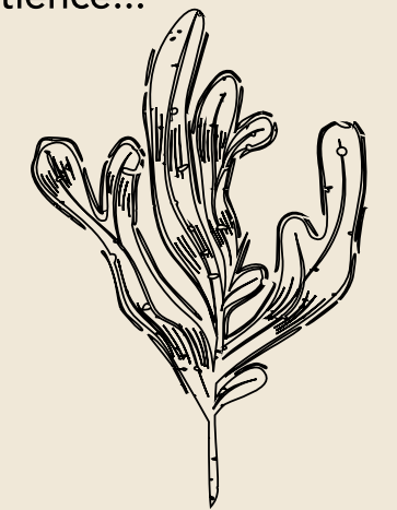
*Laisse de mer : ce que la marée laisse en haute plage.