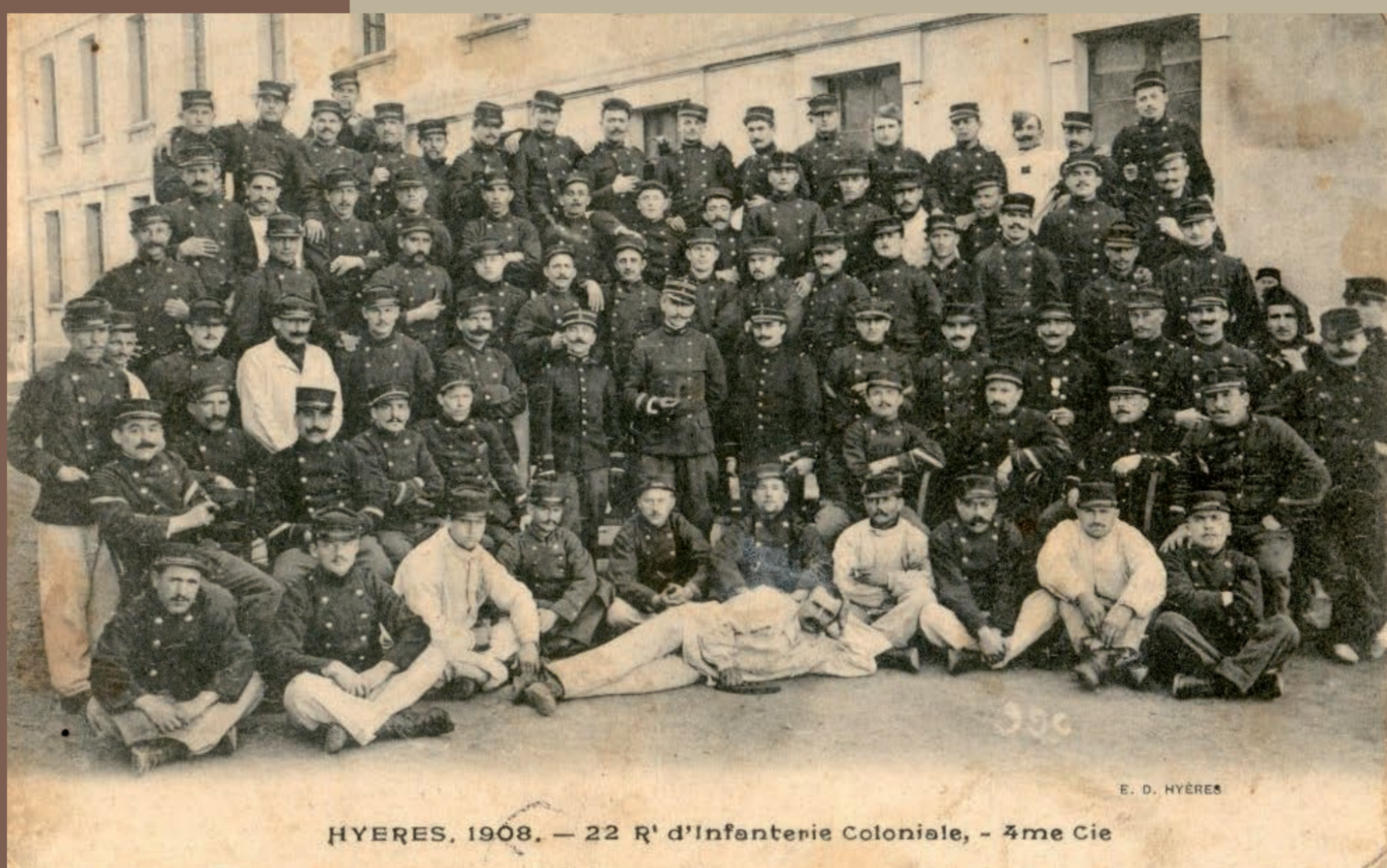
HYÈRES, 1908. — 22 e R e d'Infanterie Coloniale, - 3 e me Cie

31 Sarzeautins affectés dans les régiments d'infanterie et d'artillerie coloniale 7 Sarzeautins affectés chez les tirailleurs indigènes et les Zouaves