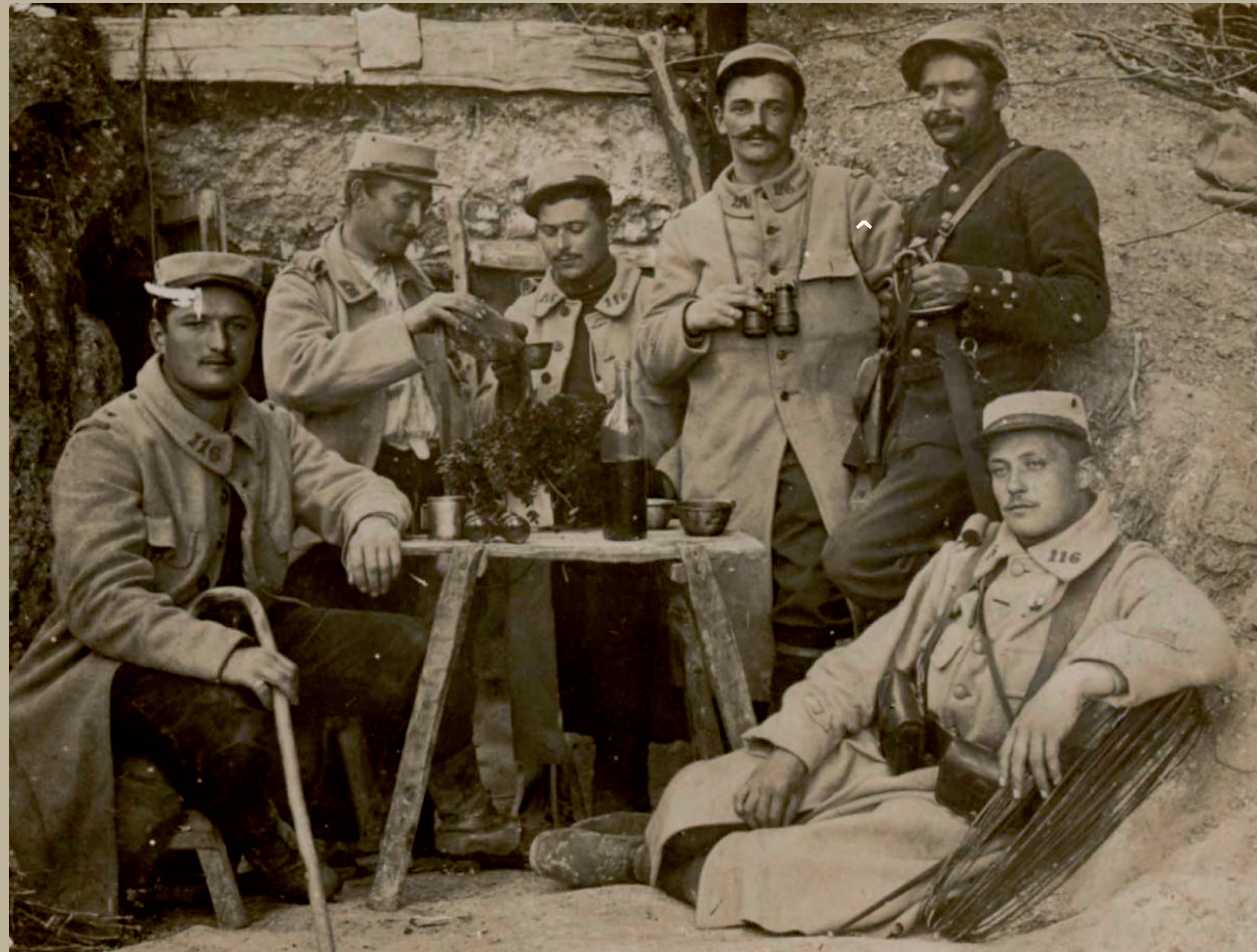
Soldats du 116 e régiment d'infanterie dans une tranchée, 11 mai 1915 (collection privée), ARCHIVES DÉPARTEMENTALES DU MORBIHAN

4 citations à l'ordre de l'armée, fourragère jaune Sa devise : "Cent seizième de ligne : autour de ton Drapeau" Citation 1918 : "Beau régiment, plein d'allant, d'un mordant remarquable"