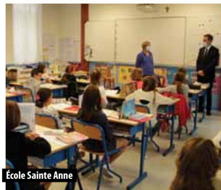
École Sainte Anne

Après le confinement, un mois de juin aux reprises parsemées et deux mois de vacances, les élèves sont enfin retournés sur les bancs de l'école. Une rentrée placée sous le signe de la prudence. De nouvelles dispositions sanitaires ont été prises par le Ministère de l'Éducation Nationale et un nouveau protocole a été mis en place dans chaque école.