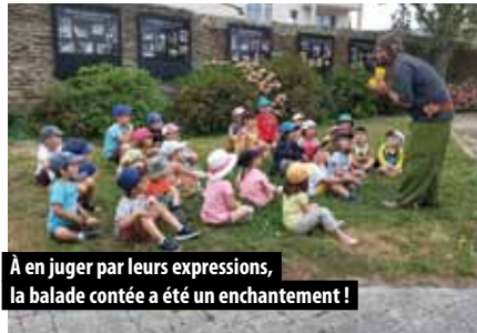
À en juger par leurs expressions, la balade contée a été un enchantement !

L'Accueil de Loisirs sans Hébergement a fonctionné durant 8 semaines, accueillant près de 150 enfants. Chaque semaine avait son thème : « la croisière s'amuse », « Bienvenue à Hawaï », « Retour aux vieux métiers », en passant par « Harry Potter » ou « Nature Zen et plaisir ». De ces thèmes ont découlé de nombreuses activités : balades en poney, voile, arts du cirque.