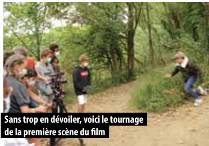
Sans trop en dévoiler, voici le tournage de la première scène du film

Cet été fut une bouffée d'air pour les jeunes suite au confinement ! Près de 70 jeunes de 10 à 16 ans, ont profité des activités proposées.