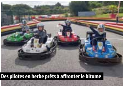
Des pilotes en herbe prêts à affronter le bitume