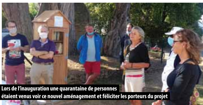
Lors de l'inauguration une quarantaine de personnes étaient venus voir ce nouvel aménagement et féliciter les porteurs du projet

La « caBANA livres », nouveau lieu de partage et de convivialité à Banastère, a été installée le 23 juillet. Initiée par des amis banastériens et fabriquée par Joël, un autre habitant du quartier et ancien menuisier, la petite cabane en forme de cabine de plage se trouve au centre du village entre le terrain de boules et la statue de Sainte-Anne. Les lecteurs sont invités à y déposer leurs livres en bon état et à y picorer d'autres lectures.