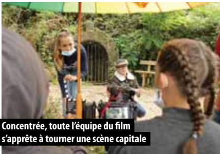
Concentrée, toute l'équipe du film s'apprête à tourner une scène capitale