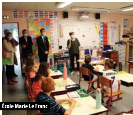
École Marie Le Franc