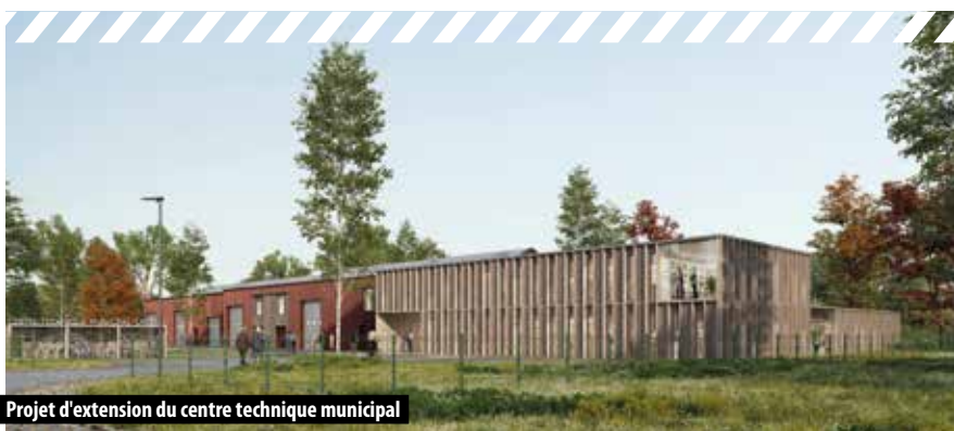
Projet d'extension du centre technique municipal

Les principaux projets prévus en 2024 sont les suivants : l'extension du Centre Technique Municipal, la finalisation de la réhabilitation du bâtiment Robert Hiebst, la finalisation des travaux de la nouvelle structure de Rhuyt Info Services, la poursuite du programme «Cœur de Bourg», le soutien à la politique du logement, les derniers aménagements de l'axe Adrien Régent, la finalisation du chai et du moulin du Poulhors, les travaux d'aménagements dans le bourg de Brillac, le lan-