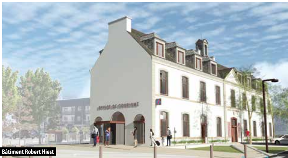
Bâtiment Robert Hiebst

60 M€ d'investissements prévus dans le mandat ”